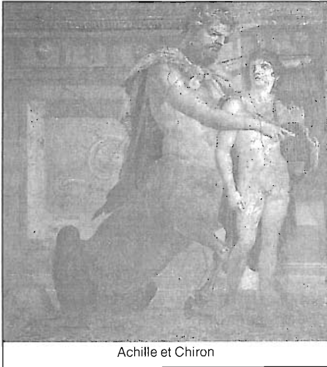
Achille et Chiron

mâna dreaptă alungă pe cineva, bâjbâie după ceva până când simte Biblia. Atunci se liniștește, zgomotul încetează, respirația îi revine la normal, iar lumina crește până la a sugera ziua-n amiaza mare.